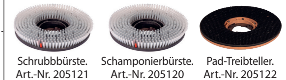
Schrubbbürste. Art.-Nr. 205121 Schamponierbürste. Art.-Nr. 205120 Pad-Treibteller. Art.-Nr. 205122