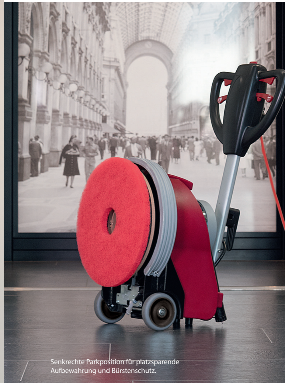
Senkrechte Parkposition für platzsparende Aufbewahrung und Bürstenschutz.