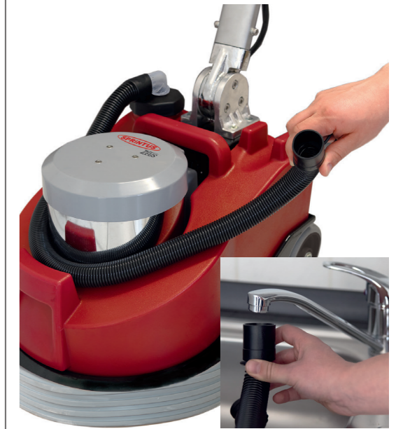
Frischwassertank kann mittels Stretschlauch direkt am Wasserhahn befüllt werden.