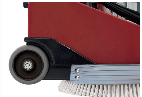
Große, nach hinten versetzte gummierte Räder für einfachen und geräuscharmen Transport.