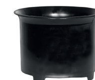
Zykloneinsatz zum Nasssaugen.

Durch den Drall am Einlassstutzen wird der Sprühnebel an der Behälterwand abgeschleudert. Zusätzliche Filterstoffe sind nicht mehr notwendig. Die zuverlässige Schwimmerabschaltung reagiert selbst bei extremer Schaumbildung. Seitliche Kühl-Luftschlitze sorgen für konsequente Trennung von Kühl- und Prozessluft.