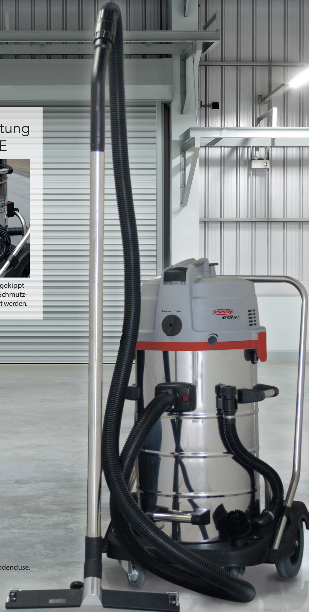
Abb. mit optionaler Metallbodendüse. Art.- Nr. 102051

Der KETOS kann wahlweise gekippt oder komfortabel über den Schmutzwasser-Ablassschlauch entleert werden.