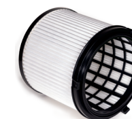
HEPA 13 Feinstaub-Filterpatrone zum Trockensaugen.