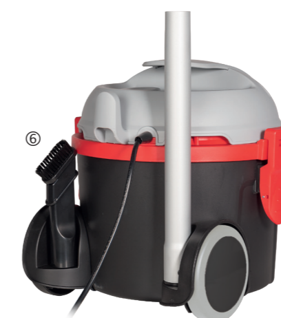
Zwei Zubehörsteckplätze an der Geräte- rückseite für die 2in1 Fugendüse mit Bürstenkranz oder Aluminiumsaugrohre.