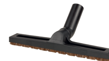
Parkettdüse 360 mm Rosshaar. Art.-Nr. 111207