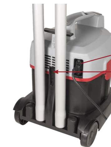
Verbesserter Komfort: Steckbares 10 m Gerätekabel.

4 Zubehörsteckplätze auf der Rückseite. Parkposition für Turbobürste oder Parkettdüse.