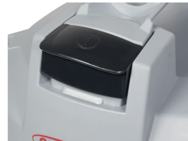
Großer Fußtaster, Ein- und Ausschalten ohne Bücken.