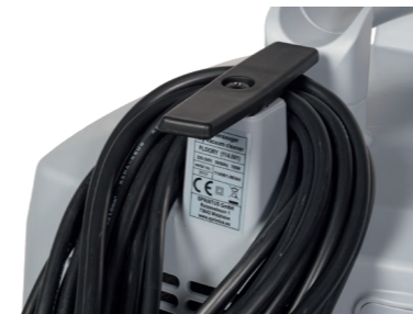
Verschließbarer, geräumiger Kabelhaken.