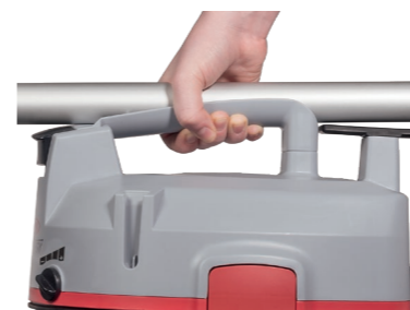
Der nur 4,2 kg schwere Sauger kann inklusive Zubehör bequem mit einer Hand getragen werden.